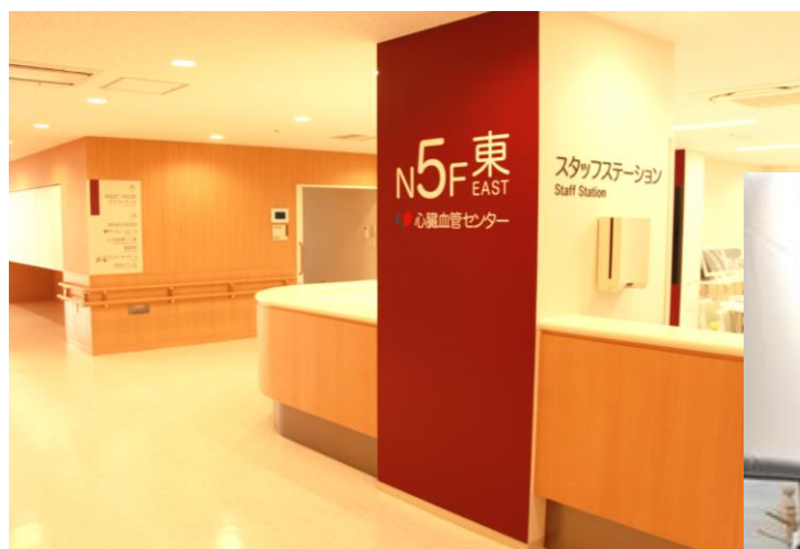
循環器内科スタッフ