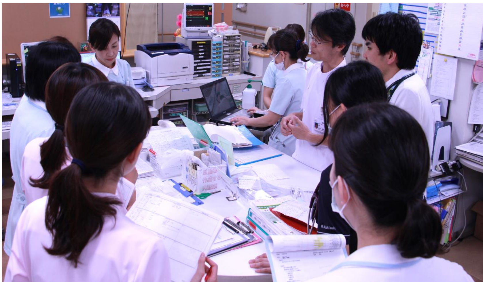
糖尿病ケアチームのカンファの様子